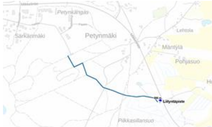
Ohjeellinen kaapelireitti ja liityntäpiste 110 kV