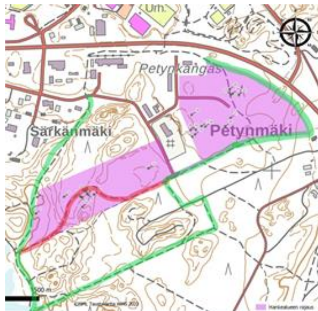
Vihreällä alustava suunnitelma muutettavaan reitistöön