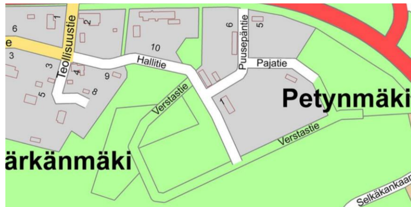
Alueen katuverkostoa opaskartan perusteella