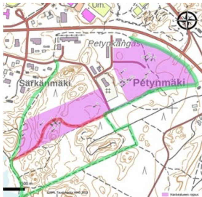
Vihreällä alustava suunnitelma muutettavaan reitistöön