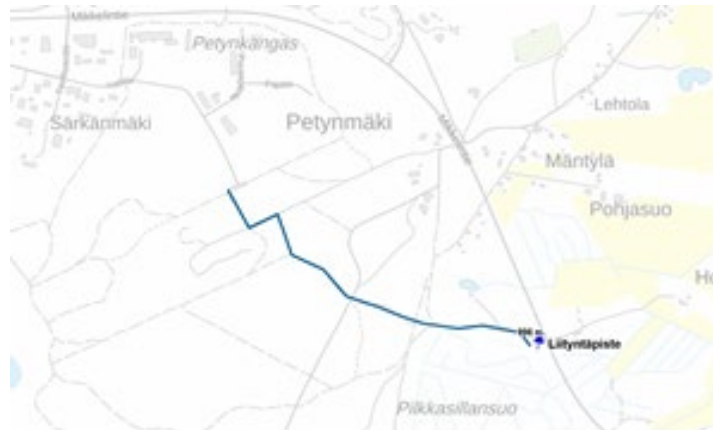
Ohjeellinen kaapelireitti ja liityntäpiste 110 kV