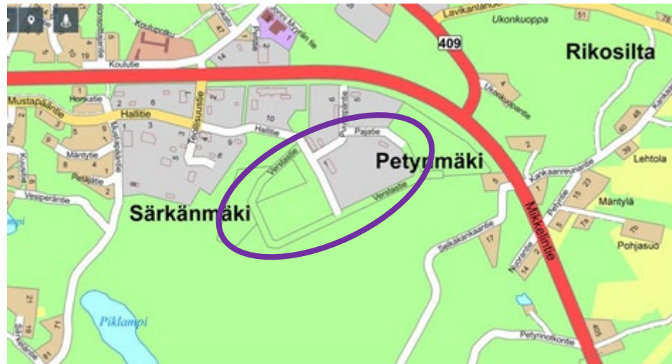
Suunnittelualueiden seudullinen sijainti

Asemakaava-alue sijaitsee Savitaipaleen kunnassa ns. Petynmäen teollisuus-alueella. Alue on kunnan omistama, mutta hallintaoikeus on annettu pitkällä maanvuokrasopimuksella Savitaipaleen Aurinkoenergia Oy:lle.