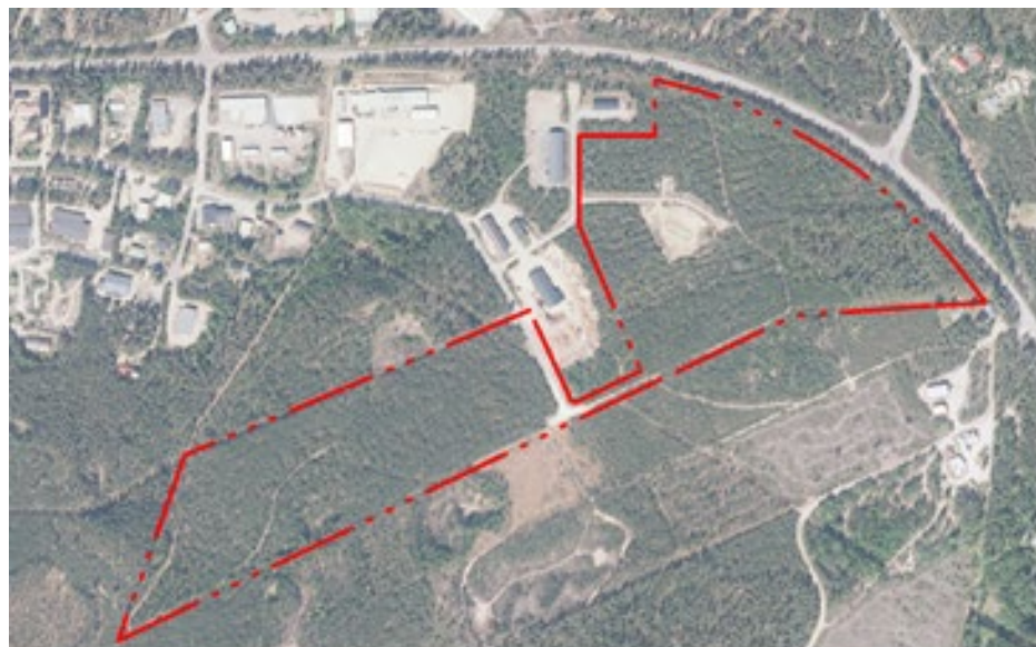
Suunnittelualueen rajaus ilmapuuvaaan sovitettuna